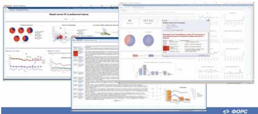
Рис. 2. Анализ чрезвычайных ситуаций (для МЧС)

использование языка Python – кстати, не в последнюю очередь благодаря активному, опережающему многие другие инструменты развитию библиотек обработки данных и машинного обучения для этого языка.